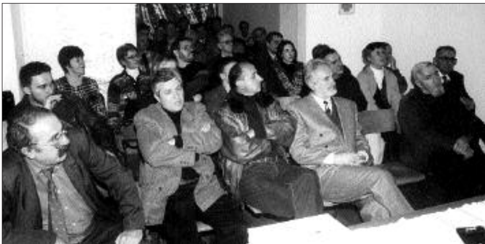
Учесници Округлог стола "Светосавска духовност и модерни српски идентитет"

Пренос Савиног тела из Трнова (Бугарска) у Милешеву 1237. био је подухват који је дао повода посебној глорификацији и уздицању његовог династичког, црквеног и народног поимања светитељског култа. У XVI веку култ Светог Саве чувао је и добар део муслимана, можда подвесно још из своје хришћанске старине. Култ Светог Саве чуван је, уз народно предање, и у мус-