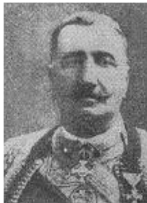
Одлучан у одбрани уједињења: војвода Стево Вукотић, брат црногорске краљице Милене