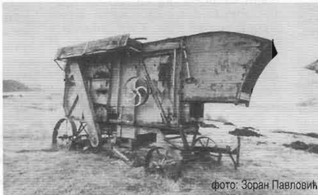
фото: Зоран Павловић