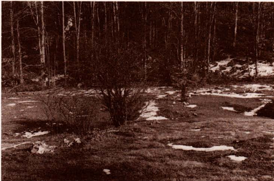
Карађорђевог шанац у Косатици