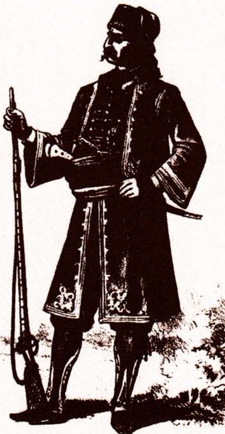
Хаџи Продан Глигоријевић

У току овог ратовања, кад је Карађорђе послао своје изасланике у Црну Гору да владику Петра I Петровића позову на заједничку борбу против Турака, с њима је био и хаџи Продан.