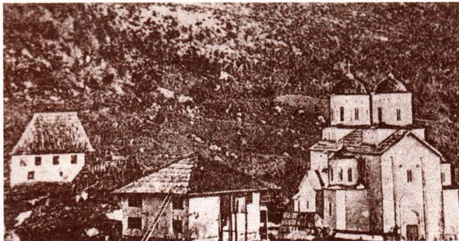
Манастир Милешева по обнови, 1880. године

За Милешеву се зна, у историографији, да је коначно била напуштена 1782. године, када су из ње побегли последњи калуђери, који су собом понели преостале сачуване драгоцености из тајне манастирске архиве и ризнице. Тако се зна да су се, крајем 18. века, у тек обновљеном манастиру Св. Успенија у Пиви – Пивски манастир – нашли грамата руског цара Петра Великог о сталној годишњој новчаној помоћи Русије Милешеви, као и неке друге манастирске реликвије и драгоцености. Међутим, Милешева је била јакo страдала, без