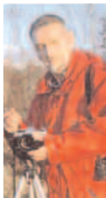
Роман Ђурић

са фотоапаратом. У ранцу су увек биле и фотографије из претходне посете. Радо је виђен гост. Мештани га дочекују као најрођенијег.