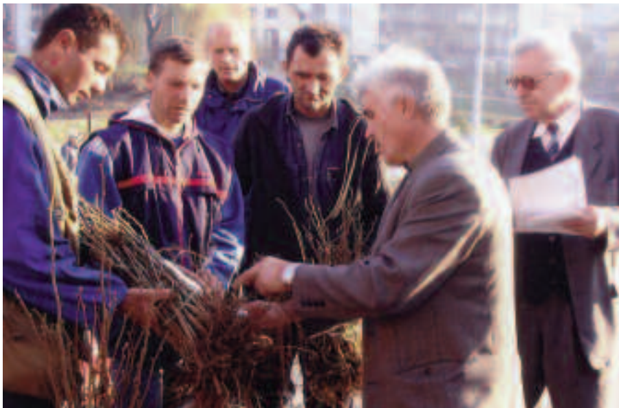
Расподела садница лешника

затке по којима треба петоструко увећати сточни фонд, унапредити технологију производње сира, обезбедити довољно квалитетне сточне хране, затим, обезбедити здравствену заштиту стоке и све остало према европским стандардима. Тешко је без помоћи државе увести робну производњу питомог лешника и при том купити и бесплатно поделити 50.000 садница до 2008. године. У 2004. години подељено је 2.500 садница купљених донаторским средствима. Расподелу 5.000 садница у прошлој години обезбедила је породи-