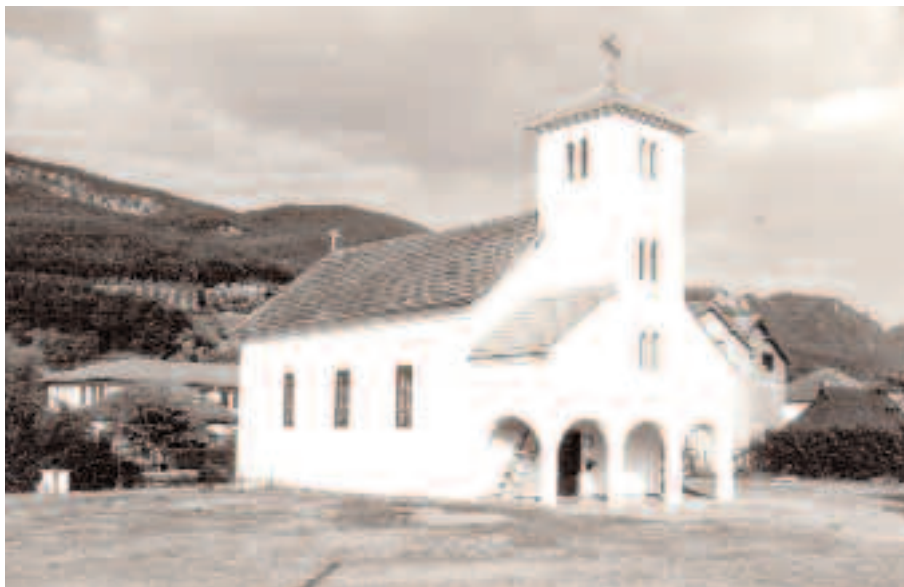
Црква у Бродареву, снимак из 1984. године

Све ово што сам претрпео, на путу, од Милешеви до Бродарева, било је много мање према стању храма у коме ћу служити Богу и људима Бродарева и околине. На седам прозора цркве није било ни парчета стакла. Западна врата на цркви поткочена са унутрашње стране једним дрветом, а врата на јужној страни завезана жицом. Иконе на иконостасу избушене бајонетима, а многих није било. Од богослужбених књига нашао сам Јеванђеље и један зборник расут по цркви лист по лист, од