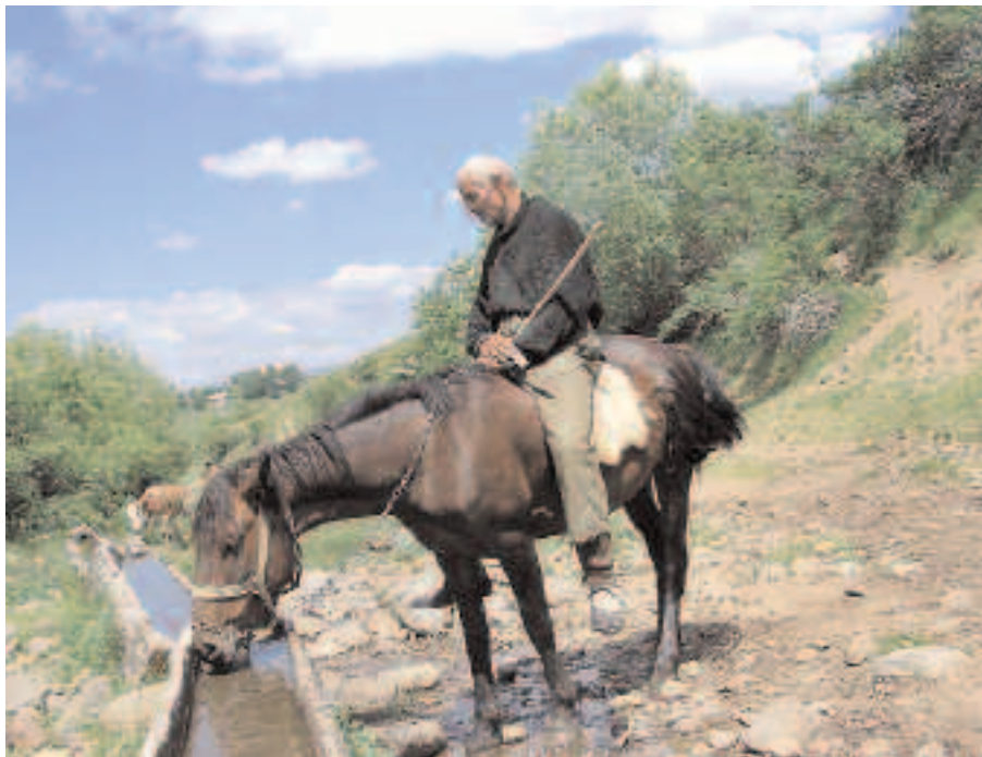
Qubomir i pomožni ~obanin zvani Kobila

И тако све док их ноге буду носиле по Љубомировој земљи.