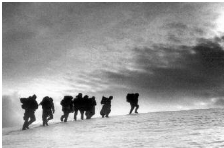
Kolona, foto Zoran Pavlović

Човек је и са друге стране фотографија Романа Ђурића и Зорана Павловића да их разгледа и у складу са својим искуством и знањем чита.