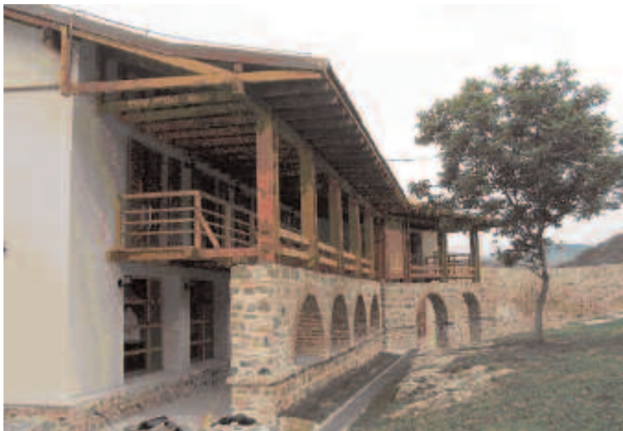
Манастир Бањска, изглед новог конака са западне стране

Нови склоп је асоцијативна реконструкција која тежи представљању духа једног времена и његовог појавног облика у садашњости. Таква представа није само визуелне или аналогне природе, већ поседује и утилитарну димензију која се остварује кроз употребну вредност новог конака. На тај начин проток времена и историјски аспект постају