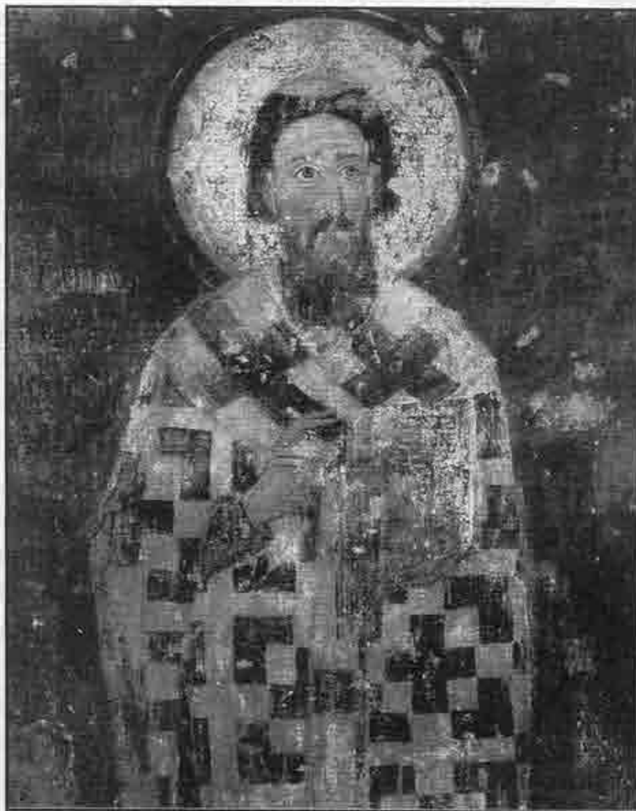
Свети Сава, фреска из Милешеве

Свети Сава је вјечити узор свим нараштајима српским у свему што је добро. Он је показао пут, ка-