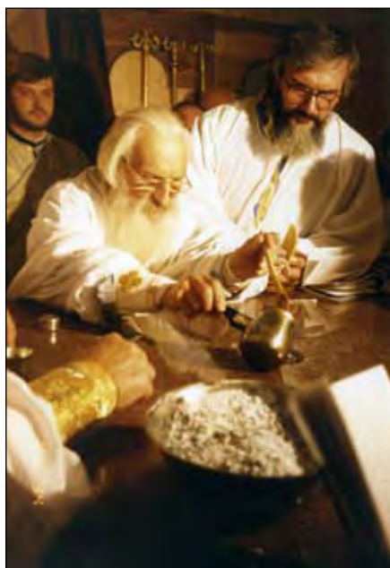
Патријарх Павле и владика канадски Георгије

Карактеристично је то да је Св. Василије Велики (који је био монах и који је саставио подвижничка правила и одредио начин монашког живота) спроводио литургијске промене у које је укључио свеколико богословље којим је