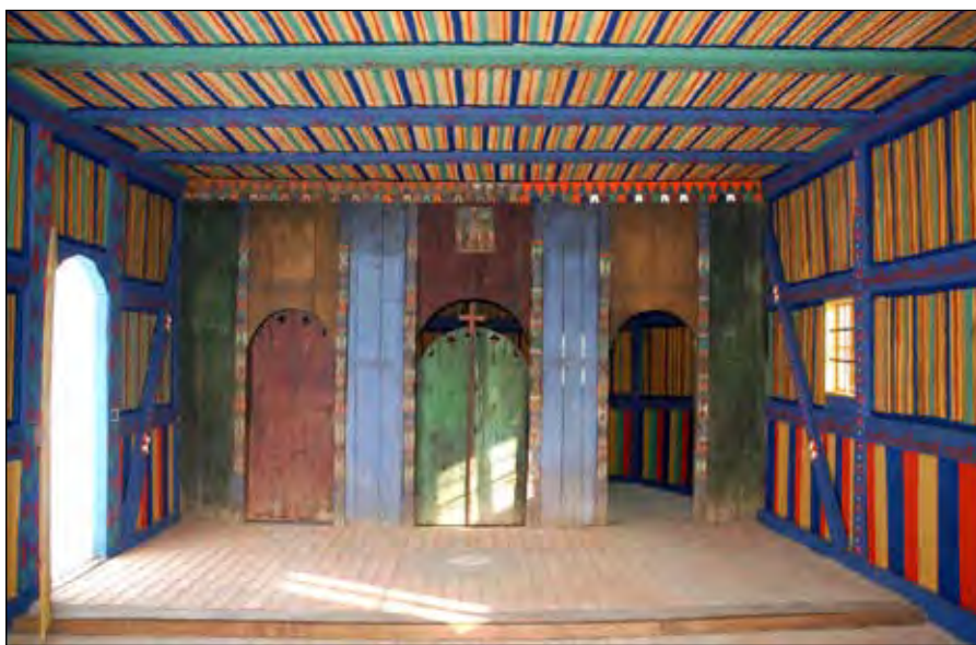
Црква у Мрсађу

ре које се сада налазе на територији Србије, грађене су у XVII, XVIII и XIX веку. Деветнаести век је обележен градњом нових цркава брвнара, али и обновом старих. Иако су те обнове добро дошле, иако су учиниле да дрвене сеоске цркве доживе садашње време, оне су често и измениле њихове првобитне облике. Преобликовани су кровови, додавани тремови или су постојећи смањивани. Па иако се, по натписима, незнатним сачуваним фрагментима или историјским изворима, зна да су многе цркве брвнаре подигнуте током XVII или XVIII века, прави печат дале су им обнове изведене током XIX века.