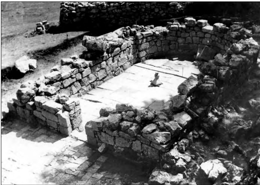
Црква Јања после археолошких ископавања 1993. године

После службе, писак трубе увачким кањоном обзанио је Старовлашанима радосну вест, чекану неколико векова, да обнова храма испод Јањине стијене сутра почиње. За дан – два, захваљујући савременим комуникацијама, за ову обнову се сазнало на свим меридијанима, баш како каже наша народна пословица: „Добар глас се далеко чује”.