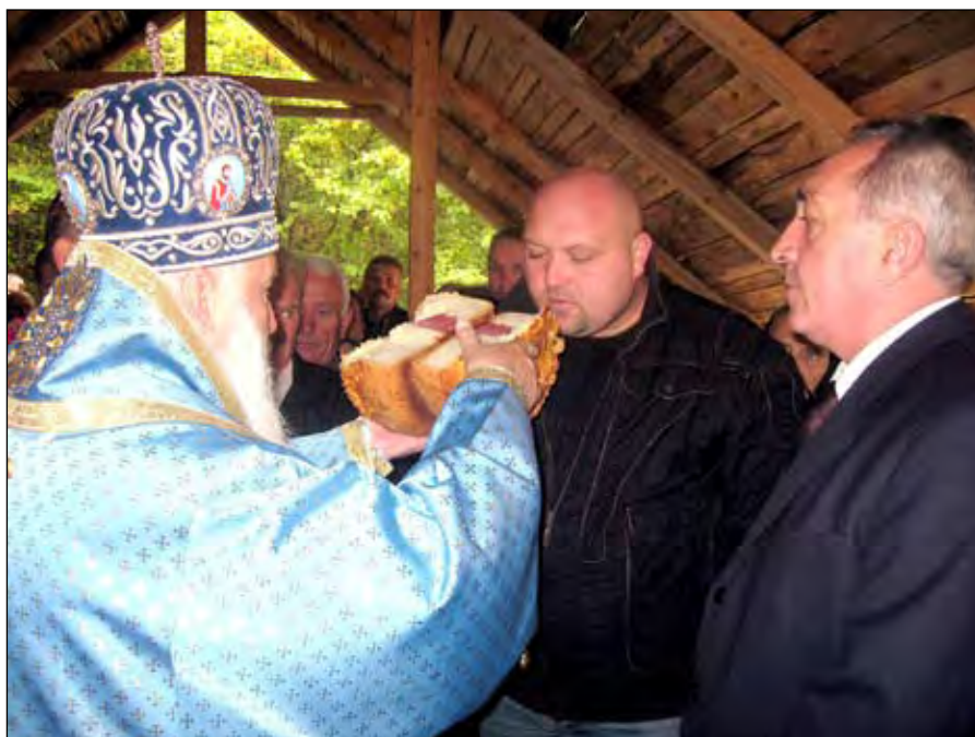
Ломљење славског колача

На основу изгледа цркве могло се закључити да је она подигнута у турско време, у другој половини XVI или првој половини XVII века. Такође се видело