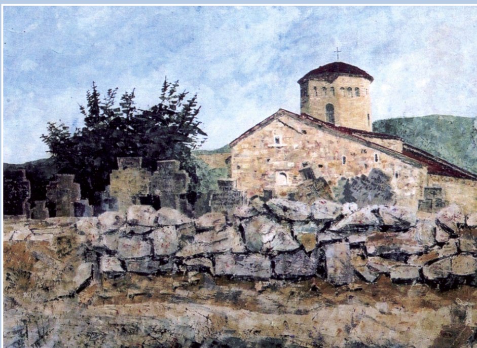
Веселин Нишавић Вешо, Пейрова црква уље на платну