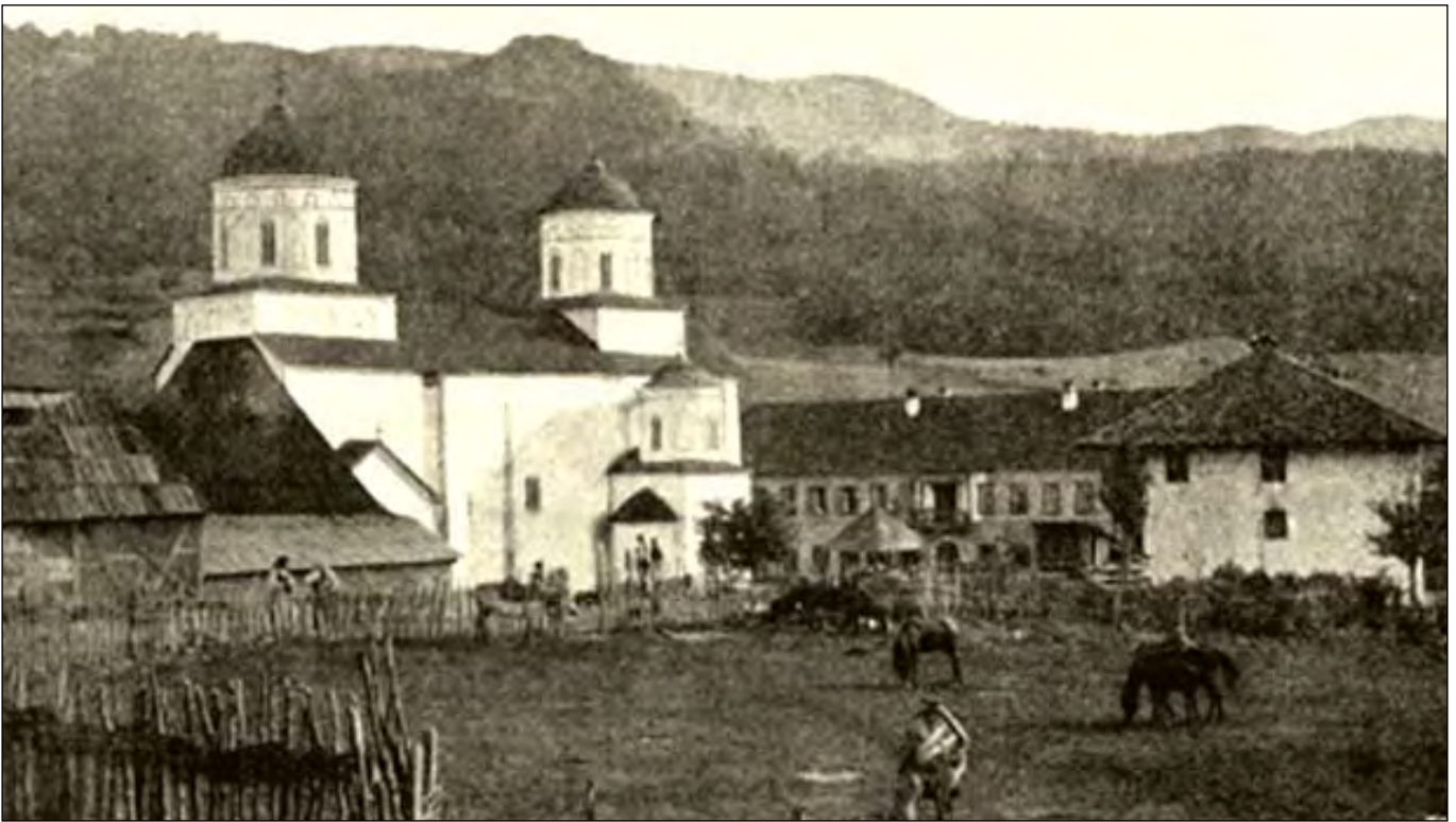
Милешева - изглед из 1890. године.

рија о имовном стању из тог времена као и животу у забити Санцака. За васкрсавање Милешеве поклањане су: овце, јагњад, козе, жито, јечам, пшеница, зоб. Ретко је прилаган новац, јер га и сами нису имали. Свест о неопходности враћања Велике лавре на место коме је припадала била је пресудна.