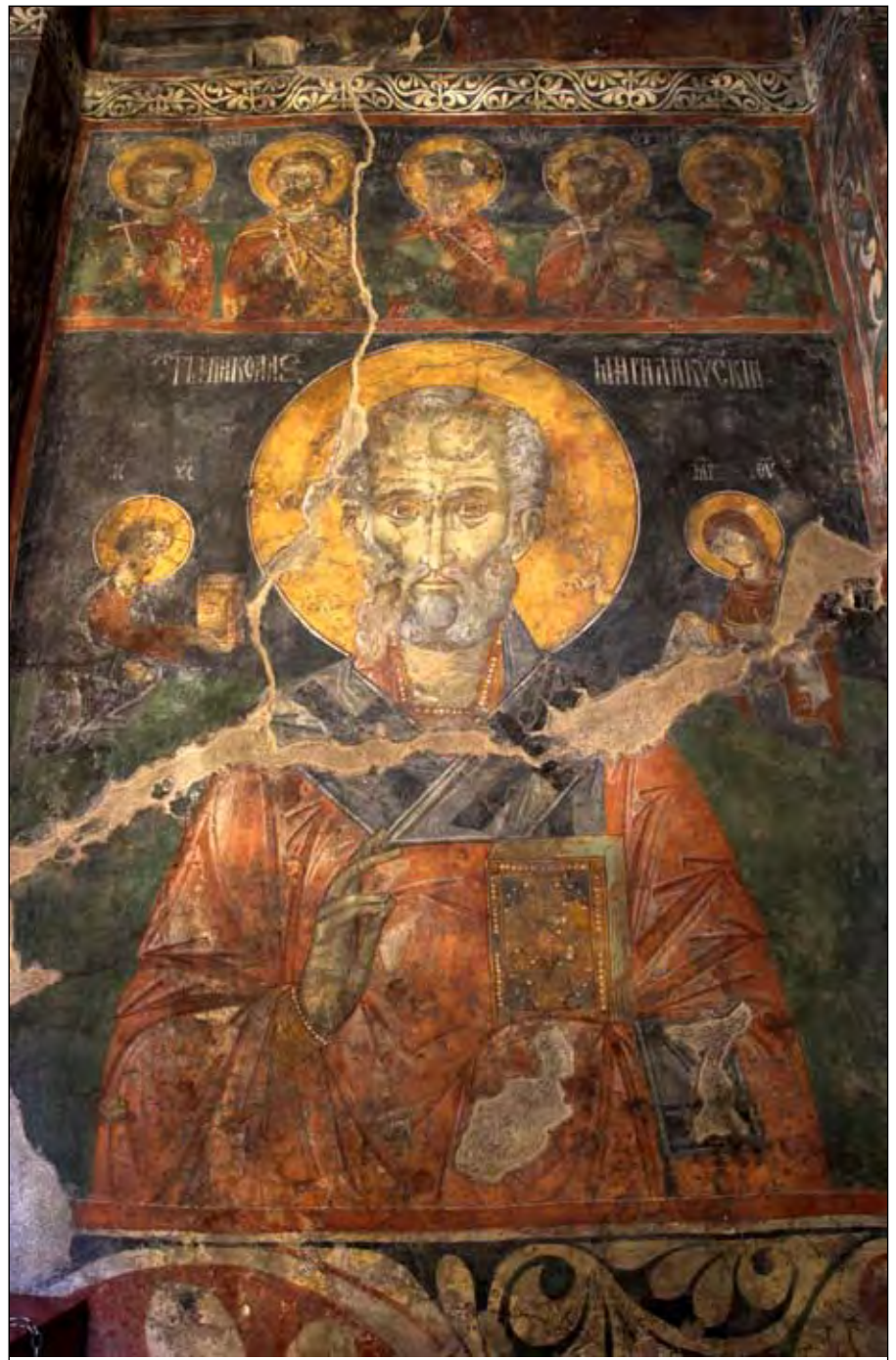
Свети Никола - фреска из манастира Градиште

Унутрашњост цркве Св. Николе била је комплетно исликана фреско живописом. О потреби и пажњи да сваки дио цркве, па и онај који се сликарски може занемарити, буде исликан свједоче фрагменти фресака унутар зидова прозора. Овдје би могли истаћи ликовно необично успио лик стојећег Св. Јована Дамаскина. Непосредно изнад пода одакле опочиње живопис ове цркве налази се сокла орнаментисана палметима. Иконографија прве зоне садржи фриз стојећих светитеља, Св. ратника и пустињака, међу којима се истиче сцена на сјеверном зиду, која представља »Причешће Св. Марије египатске«. Фриз светитеља на истом зиду се завршава монументалним попрсјем Св. Николе, патрона храма. Св. Никола је представљен у натприродној величини (висина попрсја износи 170 цм.), фронтално, са књигом у лијевој руци, док десном руком благосиља. Изнад ове зоне са, углавном, стојећим светим ликовима, представљене су допојасне фигуре светитеља. На западном зиду налази се композиција »Успење Богородице«, иконографски, на овом мјесту устаљена још од XIII вијека. Поред ове композиције на истом зиду представљене су још три епизоде, и то: »Вазнесење Богородице«, епизода о Томи и Јевреју Јефонију. На источној страни, у конхи апсиде, такође за то мјесто уобичајена, насликана је представа Богородице »Оранте« са Христом младенцем на прсима. Изнад попрсја пророка, у своду, представљене су сцене мучења из живота Св. Ђорђа (сјеверни дио) и Св. Николе (јужни дио). Иконог-