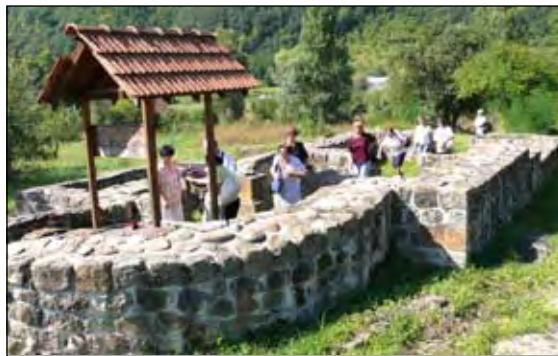
Темељи Немањине цркве