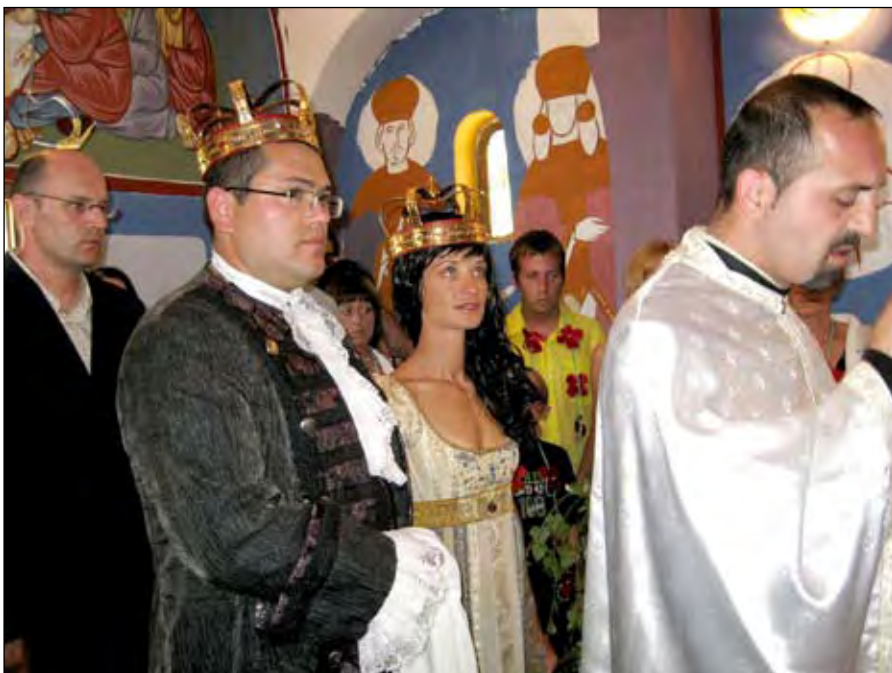
Прво венчање у новоизграђеној цркви у Сопотници

Цркве у Сопотници и Бабинама освештао је августа 2008. епископ милешевски Филарет са свештенством епархије и предао је у аманет садашњим генерацијама и потомству.