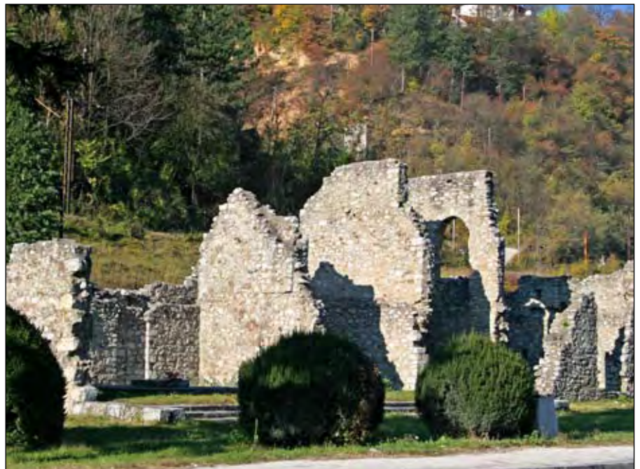
Спомен обележје „4.децембар”