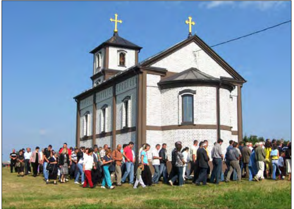
Црква у Бабинама – саграђена прилозима и мобама