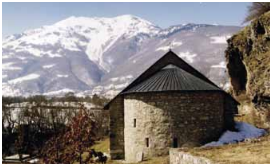
Црква у Брезоевици код Плава

Ако неки хоће да некуда дену овај Минеј од храма св. Николе и Усѿења Пречисѿе, са некаквом ѿреваром ѿвола, или неком у залоѿ да, и ѿако одвоји од цркве св. Николе, ѿакви да су ѿрокљѿѿи и ѿрикљѿѿи од Сѿаса Свѿдржѿиѿеља и Пресвѿѿе ѿѿгове маѿере и свѿеѿога чудоѿтворца Христѿова Николе....“