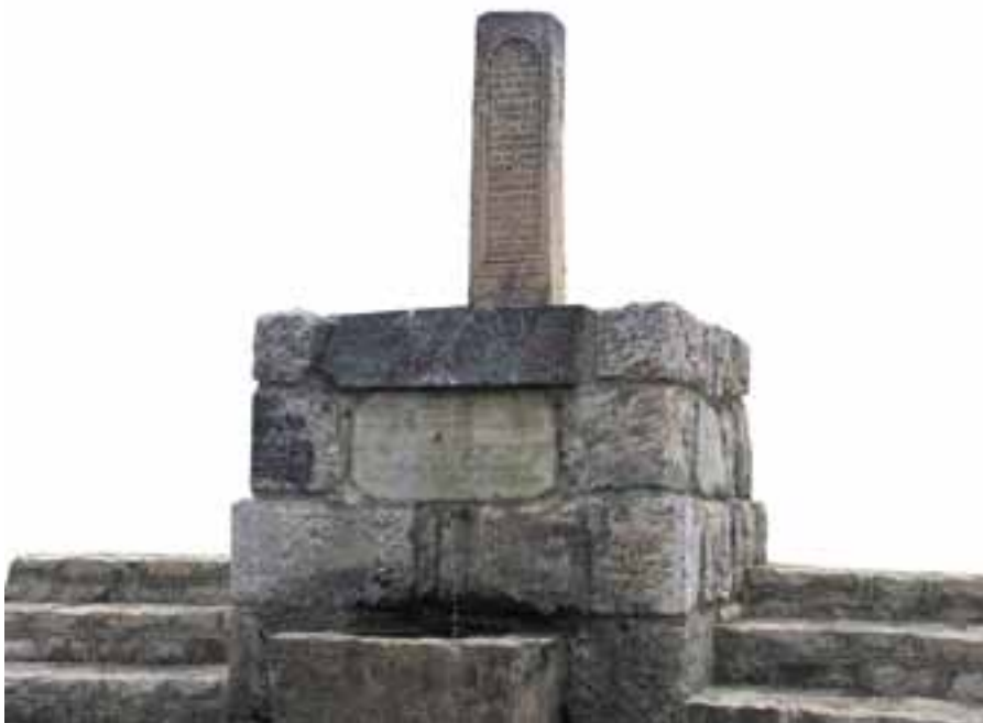
Спомен чесма породице Рашковић у Брезови на Катифима