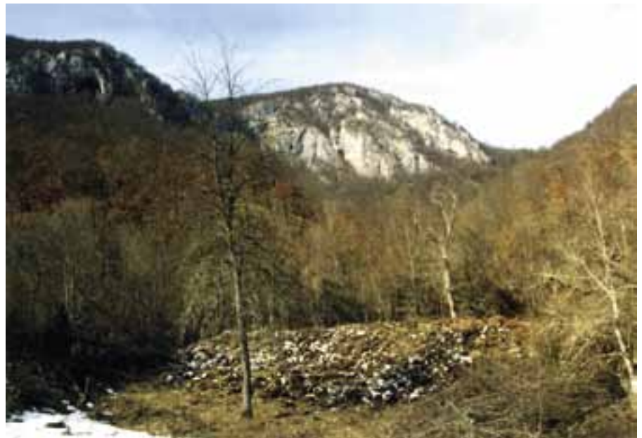
Локалитет манастира Заступа

Свака интерпретација прошлости носи у себи извештан ризик. Прошлост српског народа која је у својој бити епског карактера, тај ризик увећава. Документи из архива као превасходно доказни материјал о догађајима из историје, припадају неким другим народима, чији су