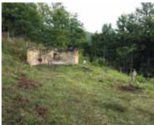
Ојковица, црквина у Варкашевини

вице и Увца испунила вода, богомоља је остала без копненог прилаза, веома тешко приступачна, а становници Ојковице, расељени на различите стране, ретко су је походили. Временом је зарушена и запустела. У некадашњем олтару, под отвореним небом, лежи пала часна трпеза, а катанац и браву којом су некада отворана црквена врата лагано једе рђа на олтарском прозору. На исти начин дотрајава високи свећњак срцолико обликоване металне површине са урезаним натписом који се још може читати: „ Цркви негбинској сѣомен родитиљима ѣрилажу сино-