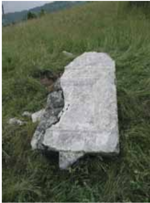
Ојковица, римски споменик