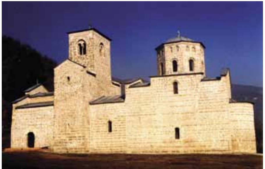
Ђурђеви ступови код Берана

На основу једне старе и на срећу, сачуване повеље, зна се да је ктитор св. Богородице бистричке у Вољавцу код Бијелог Поља био Стефан Немања. Из повеље сазнајемо да је манастир даривао великим поседима, као и са неколико околних села. Ову традицију наставили су наследници Немањића, штитећи повељама права и имовину бистричког манастира. Из једне друге повеље краља Владислава, Немањиног унука, види се, да је он манастиру „...Пресвечије Богородице у Бистрици дарова села и људи, калуђере и себри...”. Била је то потврда већ изгубљених хрисо-