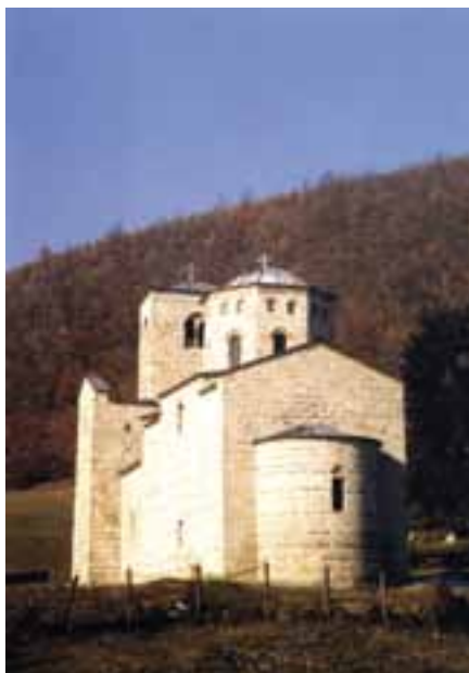
Ђурђеви ступови код Берана

Ипак, најдоследнији истраживач Полимља био је, без сумње, професор Дероко који је са неколико студената на брдским коњанима двадесетих година XX века, путовао долином Лима. Његов концизни текст публикован после неколико година (На Светим водама Лима), драгоцен је по верним цртежима објеката које је видео и снимии. Упоредујући делове Дероковог рукописа са радовима насталим касније, стиче се ути-