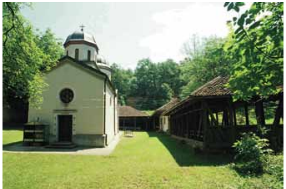
Црква у селу Јарушице у Шумадији где се претпоставља да је сахрањен Максим Рашковић

После Букурешког мира настало је мирно стање у Србији. Одредбе овог уговора, за које су Руси гарантовали, односиле су се и на Србију и на Турску, а по њима је било забрањено прелазити тада успостављену границу између ове две земље. У то