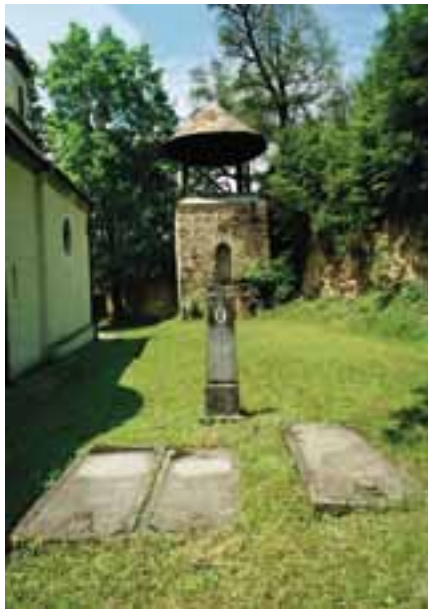
Надгробне плоче у порти цркве у Јарушицима

Није било лако савладати слободомље овог горштака изузетне храбрости који је у бици на Таламбасу, на Златибору, успео сам да разбије два буљуга Турака. Ту борбу су посматрали и Срби из шанчева заједно с Карађорђем и запрепашћени Турци, с друге стране. Када је коњ кнеза Максима клонуо од напора Карађорђе је наредио Милошу Обреновићу да му да свога коња. Милош је морао да изврши вождово наређење, али је храбри Максим сломио и овога коња, уништио та два буљуга Турака и изазвао огромно дивљење како Срба тако и Турака. Милош му је тражио да му исплати коња који је одмах после боја угнуо. Међутим, вожд је пресудио да га не плаћа. Кажу да је Милош тада замрзео кнеза Максима ради чега је за време