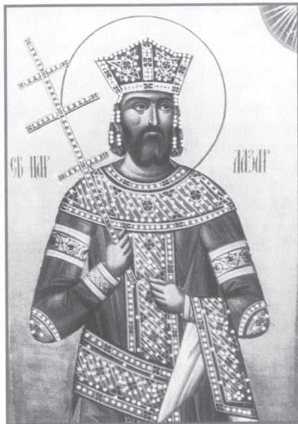
Иконе Царице Милице и Светог великомученика цара Лазара

дало је повода да се касније код ново-подигнуте цркве установи народни сабор на Светог Илију, који се одржао до данашњих дана. Захваљујући том сабору, црква је најпосећенија, од стране верника, у току године.