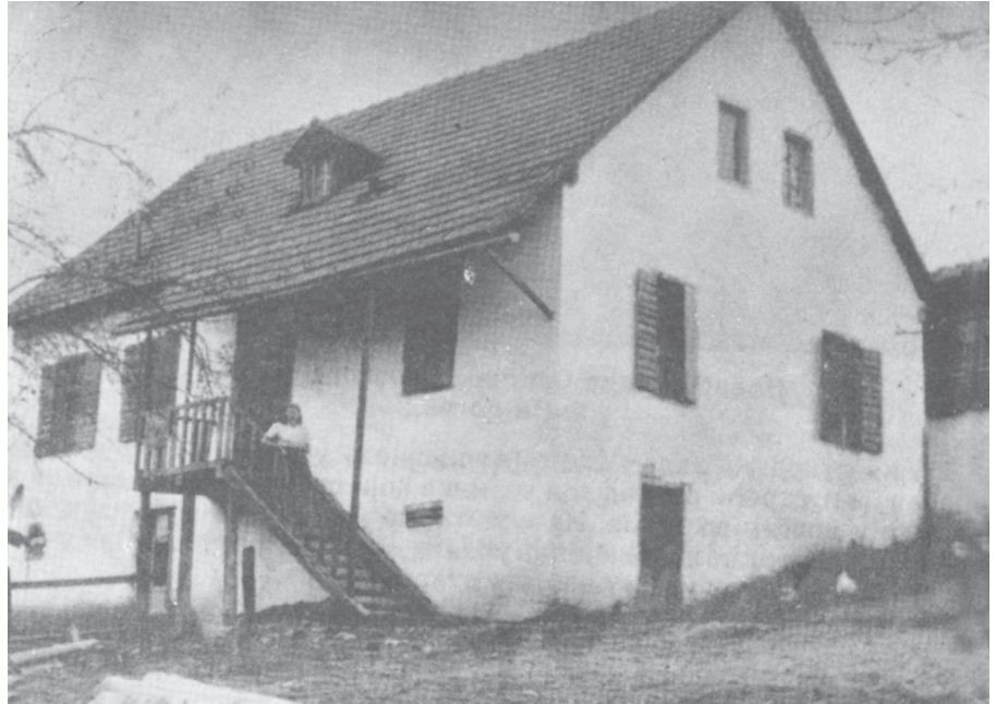
Стара школа у Виноцкој

Ш колске 1963/64 школу похађало 683 ђака, данас 203. Са радом престала издвојена одељења у Каменој Гори и Мијанима. У одељењу у Хртима школу похађају 3 ђака.