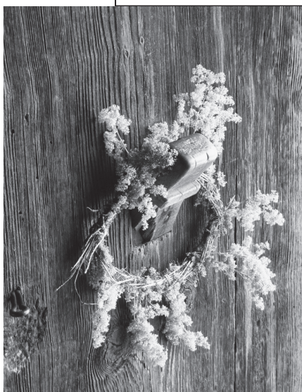
Венчић ивањског цвећа на вратима куће

Ако би ме ко год позвао на сито миља иуито да ја походим, и ако би ме зајмо с кориом лепоће свежеј воћа настрада, онда дих иото мишљења био, да учињеном иуито иошитоно одговара овака настрада.“