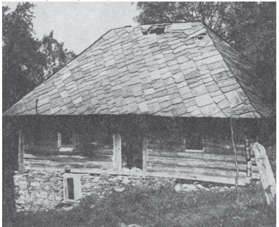
Школа у Миланци из 1853. године