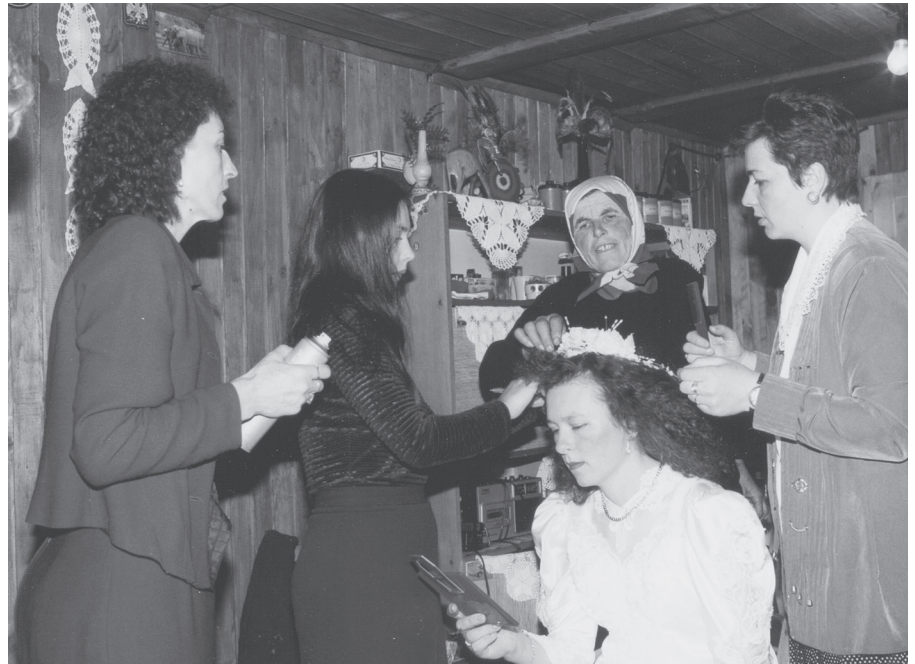
Кићење невесте у Страњанима

П ромењене друштвено економске прилике утицале су на породицу и обичаје у животу људи. Запажене су промене карактеристичне за обичаје везане за животни циклус који се састоји из три битна момента у животу сваког појединца. То су рађање-настанак живота, склапање брака-заснивање породице и смрт.