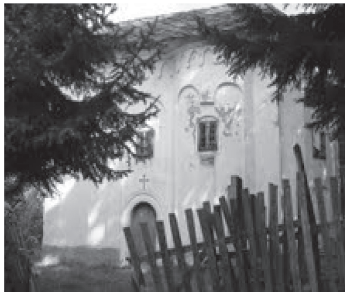
Завичају се одужио подизањем школе и цркве о свом трошку