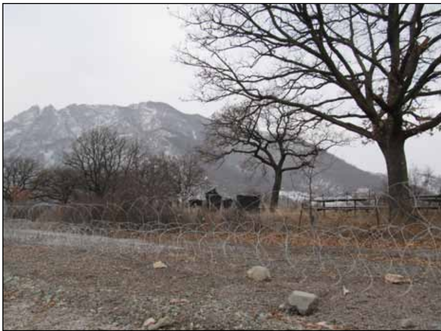
Јарињско гробље у жици

Туте на барикадама. Кад плачу, оду негде где их нико не види.