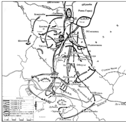
Ратна дејства Јаворске бригаде

После сламања турског контранапада 23.октобра на линији Кањевско брдо -Бели камен јединице Јаворске бригаде су запоселе Лупоглав, доминирајући положај према Сјеници из правца Јавора и Кладнице. Са тог положаја је српска артиљерија могла да веома ефикасно бомбардује Сјеницу. Друга колона српске војске се са Бачије спустила се у село Вапу и долину реке Вапе чиме је спољна одбрана Сјенице била разбијена. Сутрадан 24.октобра од раног јутра вођене су борбе на прилазима граду: Бабињачи, Шушурама, Дубници, Радишића брду, Дубињу и Пети. Турске снаге у јачини од око 3.000 војника и артиљеријом од шест спорометних топова су биле разбијене и у нeredу су се повлачиле према Пештери, Пријепољу и Дугој Пољани. После тога је делегација грађана Сјенице по други пут дошла у штаб Јаворске бригаде и замолила да се град не бомбардује понудивши и предају града. Понуда делегације је била прихваћена и српска војска је ушла у град око 14 часова 24.октобра 1912.године. Тако су Кладница и Сјеница биле дефинитивно ослобођене.