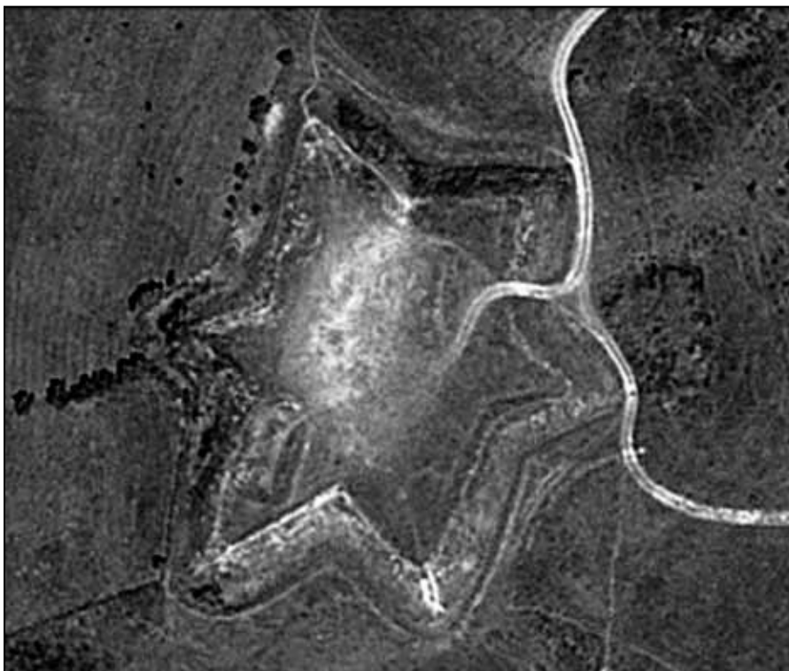
Шанац на Паричком брду

Другог дана након ослобођења наређена је предаја оружја и то је у граду спроведено у потпуности. Наређено је и да се све радње поново почну да раде. Занимљиво је да се тада у радњама затекло доста крижаног дувана, који се продавао на слободној продаји, што је условило да његова продаја буде незапамћена. Српска војска трошила је само српски монопол дувана, који је коштао један грош од пакла, док је овде могао да се купи за марјаш (пет пара) дувана, колико је било једно пакло од гроша. На дан ослобођења једини инцидент у граду био је тај, што су неки војници, свака-