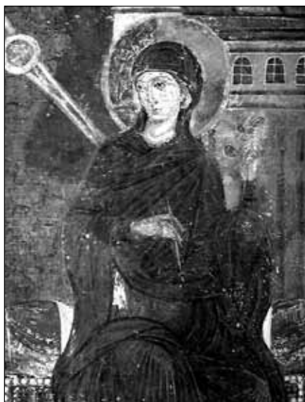
Милешева, Богородица из композиције Благовести, фреска

Последња деценија XVII века била је драматична за многа српска светилишта, али по свему изгледа да су се највеће несреће сручила на Милешеву. У егзодусу милешевских калуђера који су са собом носили све што се могло понети у бисагама, самарима и недрима – пренете су највеће драгоцености сакупљане столећима. Делови мобилијара, реликвија и књига из старе милешевске ризнице стопиле су се у ризнице других манастира. Временом, изгубљен је обавезујући кодекс једне друге епохе по коме се морају у матични манастир вратити позајмљене или у нужди депоноване драгоцености; књиге, реликвије, делови мобилијара. На несрећу заборав