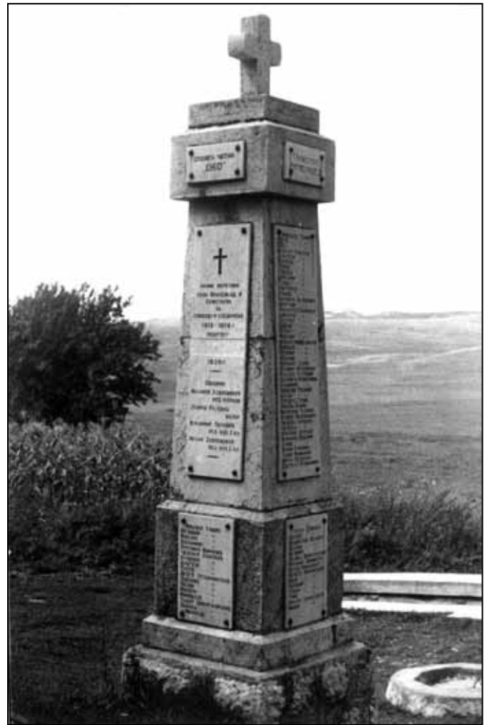
Споменик на Оку

Чесма је саграђена одмах до споменика на некадашњем извору. Због некаквих техничких немогућности, чесма је сазида на необичан и веома скуп начин. Морало се 3. метра спуштати испод извора (копати испод земље) да би он на прави начин био искоришћен, тако да је сама чесма такође за-