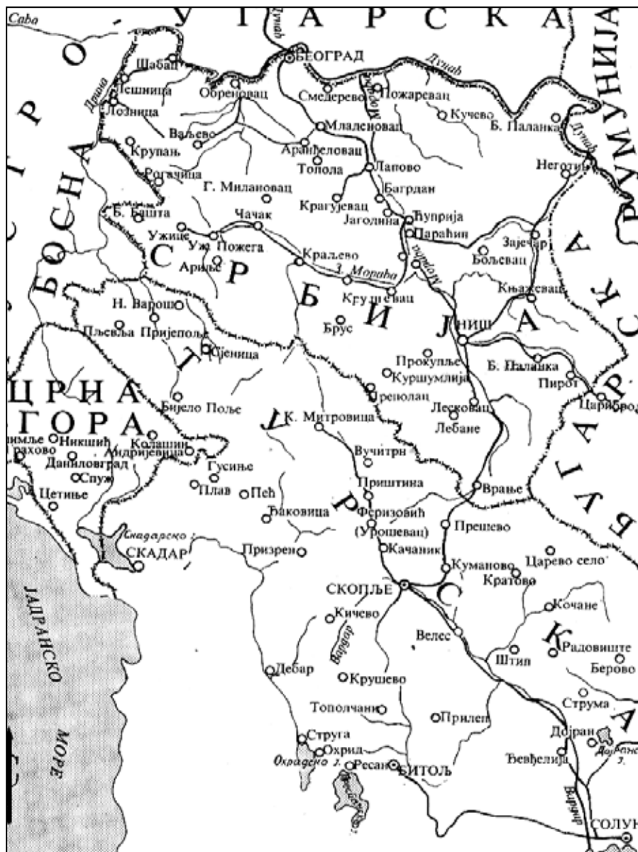
Србија и Црна Гора пред Балкански рат

ма бјелополске општине, а понеки су отишли чак у Босну (село Потоци код Глашинца на Романији).