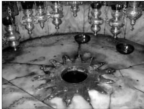
Витлејемска звезда, место рођења Исуса Христа

Гроба Господњег; представници јеврејске власти и полиције детаљно претресају патријарха како би се увјерили да негдје не крије шибицу или упалаљач. Патријарх заједно са јерменским драгуманом отпечати Цркву и прилази Гробу Господњем испред којег се кољеноприклоно моли читајући посебне молитве којима се у име свих православних моли Распетом Христу да и ове године пошаље Благодатно Огањ као свједочанство Својег Васкрсења и знак правовјерности стада православног. Док се Патријарх моли у цијелом Храму са највећом побожношћу моли се 10.000 вјерних. Свако на свом језику узноси молитве Господу. То је тренутак када сви удостојени ове благодати могу видјети Благодатни Огањ како у виду пламених плавичастобијелих муња, пламених лопти-