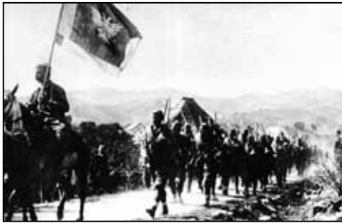
Црногорска војска у маршу

Одасвуд су стизали радосни гласови и пјесме. Дан је био сунчан, топао, јесење благ. Јелка пође из собе у собу и широм отвори све прозоре да би са сунцем ушла и нова срећа и нова нафака. Поно-