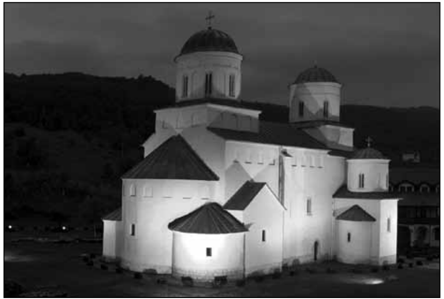
Манастир Милешева, почетак 13. века - Црква Св. Вознесења

зантијске престонице. Коначно, највећа збирка византијских дела црквене уметности чува се данас у ризници Св. Марка у Венецији.