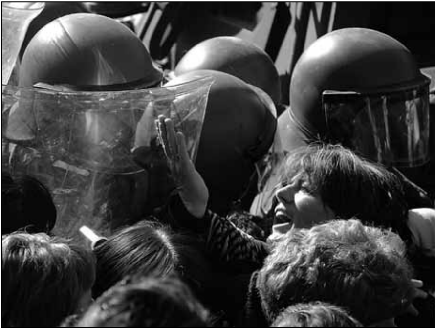
Српкиња испред кордона

Донели икону на Јагњеницу Козаци са Урала.