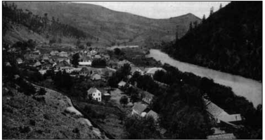
Прибој 1914. године

- Па ће му је војничко одијело додаде мудир.