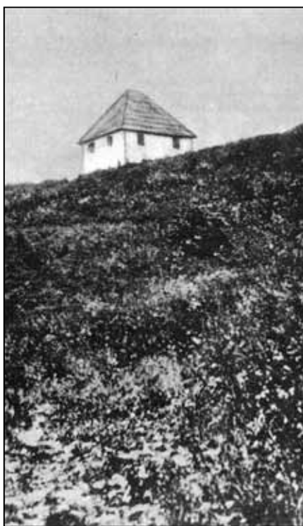
Српска караула на Јавору