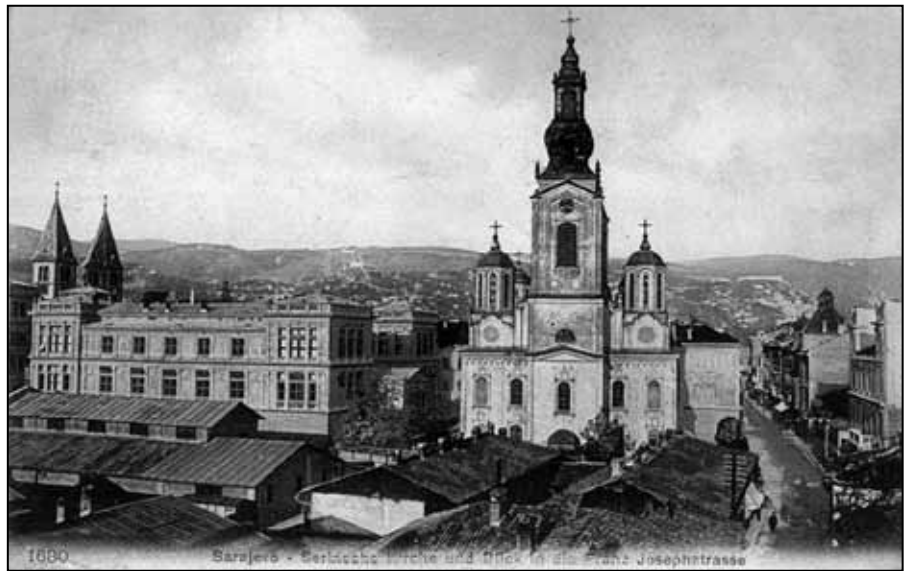
Богословија у Раљеву