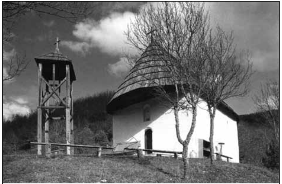
Црква у Прибојским Голешима