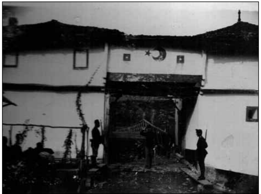
Аустро-турска царина на Лиму

О обесправљености Срба у Старој Рашкој говори и један допис из Пљеваља из марта 1909. године у коме се каже да Срби из Санцака нису имали ни једног представника на неком вишем положају. Поред представника Срба у цариградској скупштини нема ни Муслимана. А онај који их је представљао био је постављен од младотурака и никаквог увида информацијама није имао о крају који је заступао и можемо замислити како се „борио“ да се постојеће стање промени. Да им се не би приговорило, у Сенату су изабрали по националности и Србина али он није уопште познавао ситуацију у Санцаку. А када су Срби покушали да истакну свог кан-