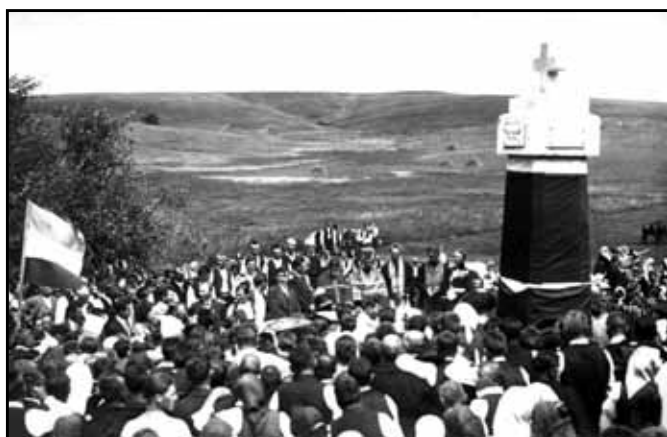
Освештање споменика на Оку 1930. године

Око као забележен топографски појам јавља се тек крајем XIX века. Међутим, назив села које је по Оку добило име и налази се у његовој непосредној близини је Очка гора, што упућује да је топоним старијег порекла, јер га откривамо још у турским пописима давне 1525. године. Друго помињање Очке горе је 1823. године поводом убиства Младена Миловановића, председника Карађорђевог Совјета, љутог Милошевог непријатеља, кога су Мићићеви момци убили у Очкој гори и бацили у тамошњу пећину Звекару.