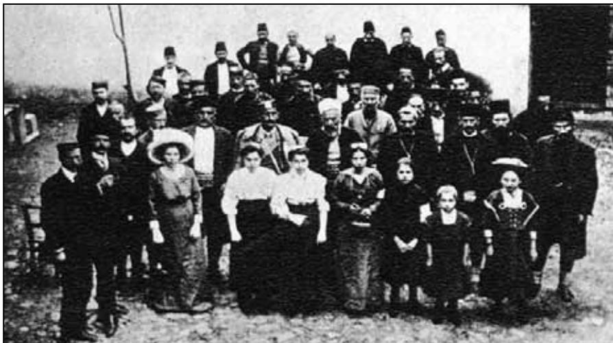
Црногорски Црвени крст у ослобођеном Бијелом Пољу

Источни одред на правцу наступања према Бијелом Пољу очекивао је окршај с око 2.000 низама и редифе и снаге башибозука. Снаге низама и редифе биле су стационаране у Мојковцу, караулама на том подручју и у Бијелом Пољу, с тим што се број резервиста могао повећати. Турске снаге око Мојковца, на правцу наступања главнине Источног одреда, имале су врло подесне одбрамбене положаје. Зато је командант одреда упутио једну групу (Колашински и Доњоморачки батаљон) да овлада доминантним положајима Бјеласице и настави наступање ка Лиму. Ова група батаљона имала је задатак да координира своје акције са јединицама васојевићким које је требало да заузму Брзаву, чије су становнике дан раније растјерали Турци и куће им