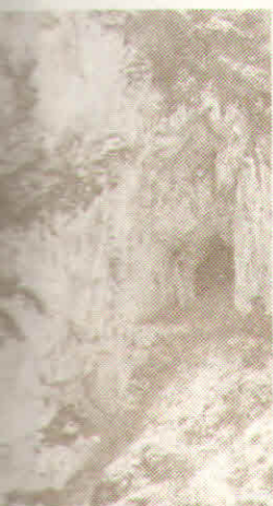
Савина код Милешева