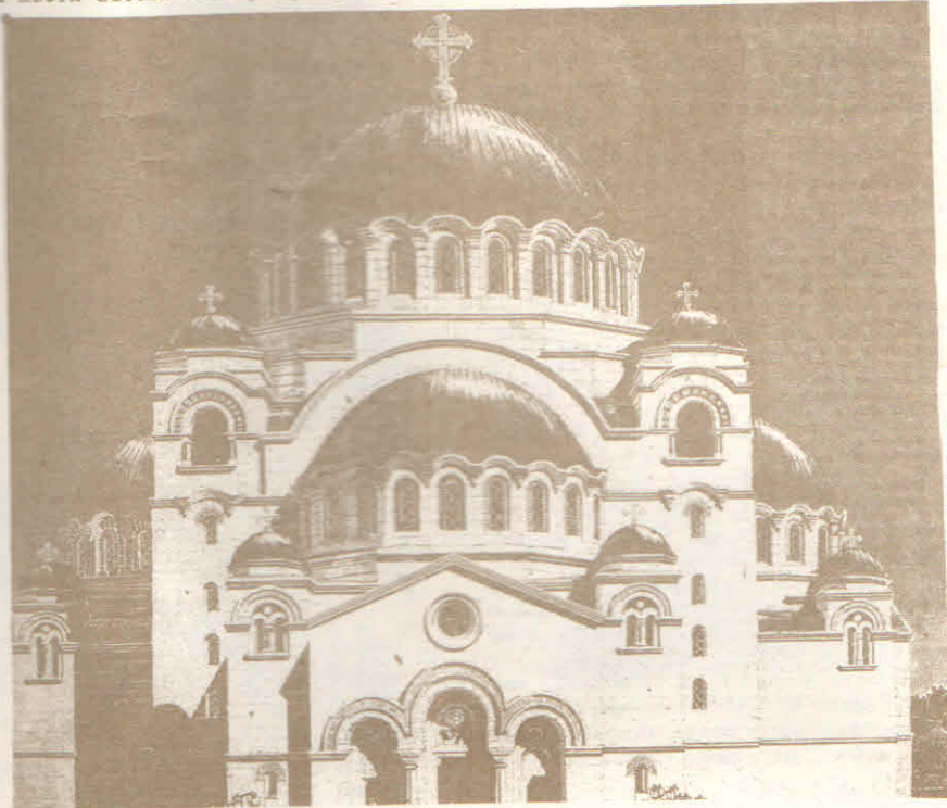
Макета Храма Светог Саве на Врачару у Београду

-паша одлучио, како би зауставио ширење устанка у Банату, да спали мошти Светог Саве, чији су лик српски устаници носили на својим заставама. Те,