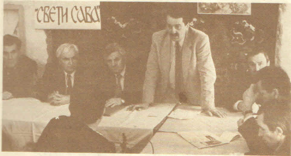
Овако је почело: са првог састанка Иницијативног одбора

По дивном, сунчаном дану, свечано обучени хрилили су људи у Дом револуције и сами не верујући да је то стварност. Са разгласа се орила „Светосавска химна”, девојке у народним ношњама су сваком