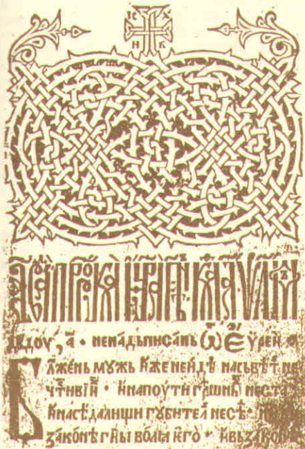
Страница из „Псалтира“ штампаног у Милешевској штампарији

За две године навршиће се 450 лета од како је у манастиру Милешеви почела да ради једна од првих српских штампарија. Њен наследник је штампарија „Милешево“ у Пријепољу. Данашње генерације